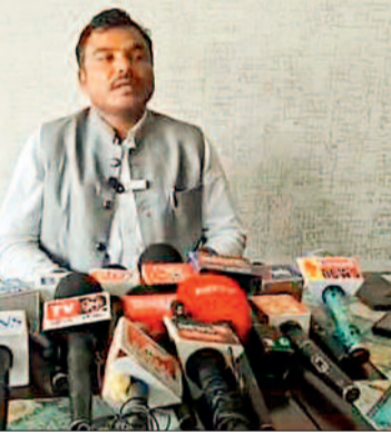
लगा है। शराब कहां से और कैसे मिला, यह मुझे नहीं मालूम, लेकिन मे ढाबा में नहीं था। ढाबा पर मेरा मुश्किल से जाना होता है, बहुत कम जाता हूँ, लगभग एक साल से वहां के कर्मचारी और मैनेजर ढाबा को चला रहे हैं। कर्मचारियों ने मुझे बताया कि पुलिस की टीम आते ही मोबाइल को छीन लिया गया। मोबाइल छीनने के बाद जिस तरह का बर्ताव पुलिस के द्वारा किया