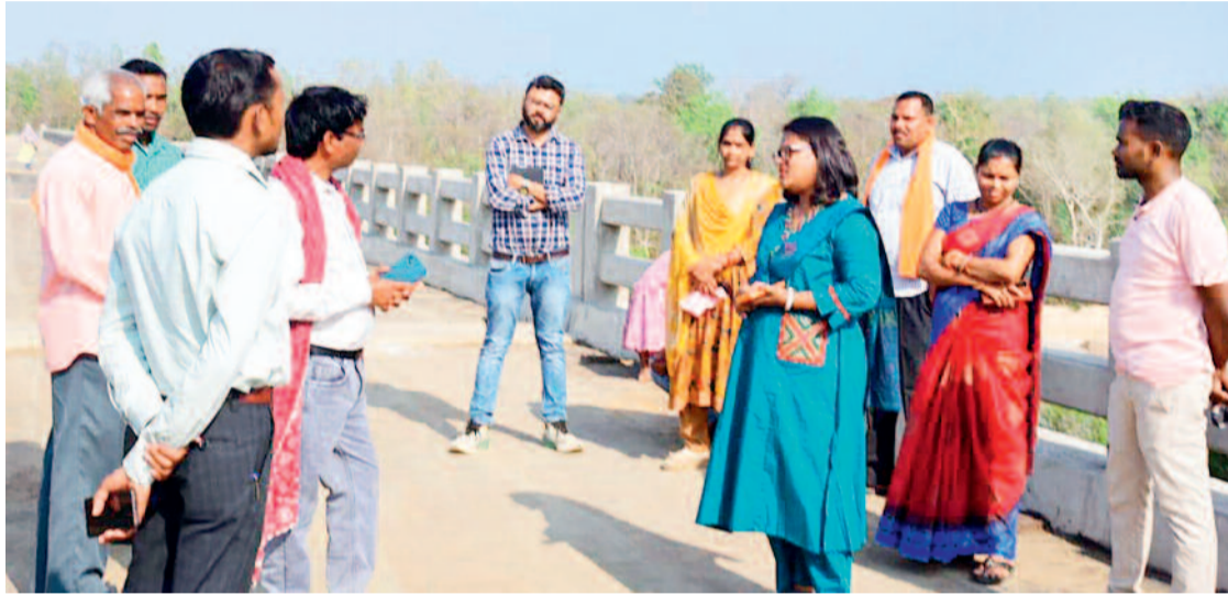
अधिकारियों को निर्देशित किया कि सभी निर्माण कार्य निर्धारित समय-सीमा में गुणवत्ता के साथ पूर्ण किए जाएं। निरीक्षण के दौरान जनप्रतिनिधियों सहित जिला पंचायत सीईओ एवं लोक निर्माण विभाग के अधिकारी उपस्थित रहे।

कलेक्टर श्रीमती नूपुर राशि पन्ना ने मर्दापाल तहसील अंतर्गत निर्माणाधीन सड़क एवं चल रहे पुल निर्माण के कार्यों का निरीक्षण कर प्रगति की समीक्षा की। ग्राम अंदरान एवं तोतर के मध्य भंवरडींग नदी पर बन रहे 234 मीटर लंबे पुल का निरीक्षण करते हुए कलेक्टर ने पुल के किनारों की पिचिंग को मजबूत करने तथा शेष कार्यों को वर्षा ऋतु से पहले पूर्ण करने के निर्देश दिए। इससे पूर्व कलेक्टर ने मर्दापाल मुख्य मार्ग से चांगेर हंगवा तक बन रही लगभग 12.90 किलोमीटर लंबी सड़क का निरीक्षण किया।