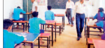
मैं अनुशासन और व्यवस्था बनाए रखना अत्यंत आवश्यक है।

दुर्गुकोदल। विकासखंड दुर्गुकोदल में संचालित कक्षा 8वीं की केंद्रीकृत परीक्षा के दौरान उड़नदस्ता दल द्वारा विभिन्न परीक्षा केंद्रों का सघन निरीक्षण किया जा रहा है। इसी क्रम में आज परीक्षा केंद्र पूर्व माध्यमिक शाला ईरागांव का निरीक्षण किया गया। दल ने परीक्षा व्यवस्था, अनुशासन और पारदर्शिता का बारीकी से निरीक्षण किया। निरीक्षण के दौरान यह पाया गया कि परीक्षा केंद्र में पंजीकृत सभी विद्यार्थी उपस्थित थे और परीक्षा पूरी तरह शांतिपूर्ण एवं सुव्यवस्थित ढंग से संचालित हो रही थी। सबसे महत्वपूर्ण बात यह रही कि निरीक्षण के दौरान किसी भी प्रकार का नकल प्रकरण सामने नहीं आया, जिससे परीक्षा की निष्पक्षता और पारदर्शिता स्पष्ट रूप से दिखाई दी। उड़नदस्ता दल के अधिकारियों ने केंद्र प्रभारी एवं शिक्षकों के कार्य की सराहना करते हुए कहा कि परीक्षा संचालन