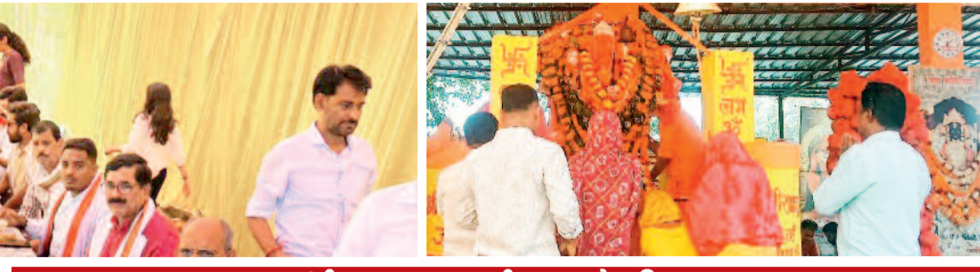
हनुमान जयंती पर हनुमान चालीसा पाठ से भवितमय वातावरण

अंचल में हनुमान जन्मोत्सव पर सुबह से ही हनुमान मंदिरों में श्रद्धालुओं का तांता लगा रहा है। जन्मोत्सव पर जगह-जगह सुंदरकांड का पाठ के बाद सामूहिक हनुमान चालीसा पाठ किया गया। इसके बाद हवन पूजन के बाद भंडारे का आयोजन किया गया। कांकेर शहर के राजापारा स्थित दक्षिण मुखी हनुमान मंदिर में सुबह साढ़े 10 बजे हवन पूजन प्रारंभ हुआ। राजापारा स्थिति ऐतिहासिक स्वंपू हनुमान मंदिर में सुबह से ही श्रद्धालुओं के पहुंचने का सिलसिला शुरू रहा, जो देर रात तक चलता रहा है। यहां दोपहर 12 बजे हवन पूजन के बाद भंडारे का आयोजन किया गया। इसमें बड़ी संख्या में श्रद्धालुओं ने प्रसाद ग्रहण किया। इसी तरह ऊपर-नीचे रोड स्थिति पंचमुखी हनुमान मंदिर में ब्रह्म मुहूर्त में भगवान हनुमान का विशेष श्रृंगार किया गया। सुंदरकांड का पाठ का आयोजन किया गया और देर शाम हनुमान चालीसा का