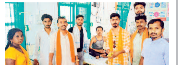
समाजसेवी युवाओं द्वारा किया फल वितरण