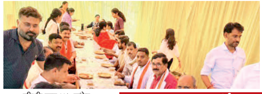
हरिभूमि न्यूज़ ▶▶ कांकेर

अंचल में हनुमान जन्मोत्सव पर सुबह से ही हनुमान मंदिरों में श्रद्धालुओं का तांता लगा रहा है। जन्मोत्सव पर जगह-जगह सुंदरकांड का पाठ के बाद सामूहिक हनुमान चालीसा पाठ किया गया। इसके बाद हवन पूजन के बाद भंडारे का आयोजन किया गया। कांकेर शहर के राजापारा स्थित दक्षिण मुखी हनुमान मंदिर में सुबह साढ़े 10 बजे हवन पूजन प्रारंभ हुआ। राजापारा स्थिति ऐतिहासिक स्वंपू हनुमान मंदिर में सुबह से ही श्रद्धालुओं के पहुंचने का सिलसिला शुरू रहा, जो देर रात तक चलता रहा है। यहां दोपहर 12 बजे हवन पूजन के बाद भंडारे का आयोजन किया गया। इसमें बड़ी संख्या में श्रद्धालुओं ने प्रसाद ग्रहण किया। इसी तरह ऊपर-नीचे रोड स्थिति पंचमुखी हनुमान मंदिर में ब्रह्म मुहूर्त में भगवान हनुमान का विशेष श्रृंगार किया गया। सुंदरकांड का पाठ का आयोजन किया गया और देर शाम हनुमान चालीसा का